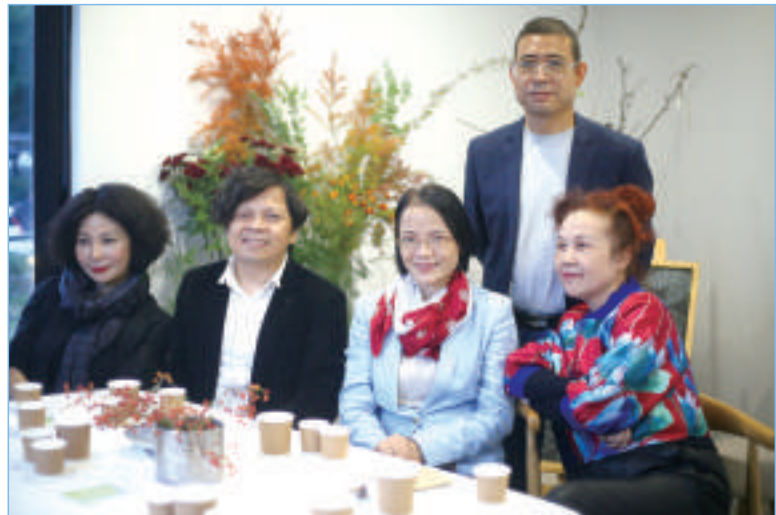
爱北滘文化共创空间，参加南方文学盛典的作家们一起品尝手冲咖啡。