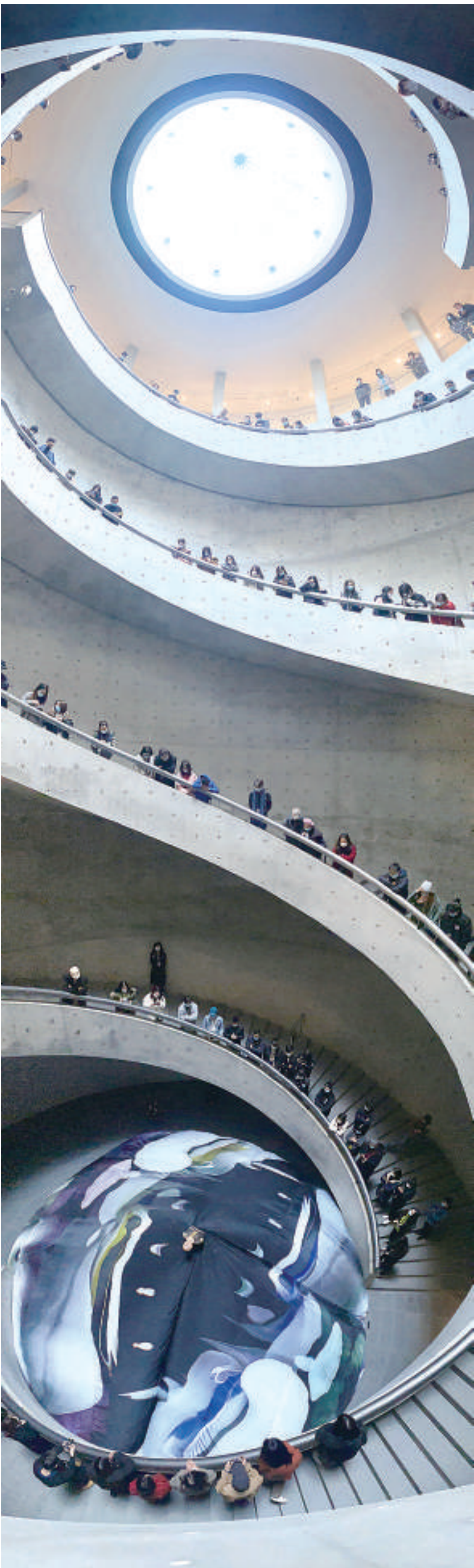
和美术馆“和·流”剧场以“圆”为主题，呈现了一场现代舞与空间融合的艺术。

在爱北滘文化共生空间“营业”的时间里，空气动力学博士、城市道路规划师、全国排名前十摄影师、国家一级茶艺师、咿呀学语的孩童、八十多岁退休老人因各种机缘相聚在这里，活动在不断研讨与学习中，解决各种各样的问题……从阅读推广到知识服务，承载着线上线下、各类人群的知识需求。这个小小的共创空间，更是一个承担社会责任的城市学习文化空间。