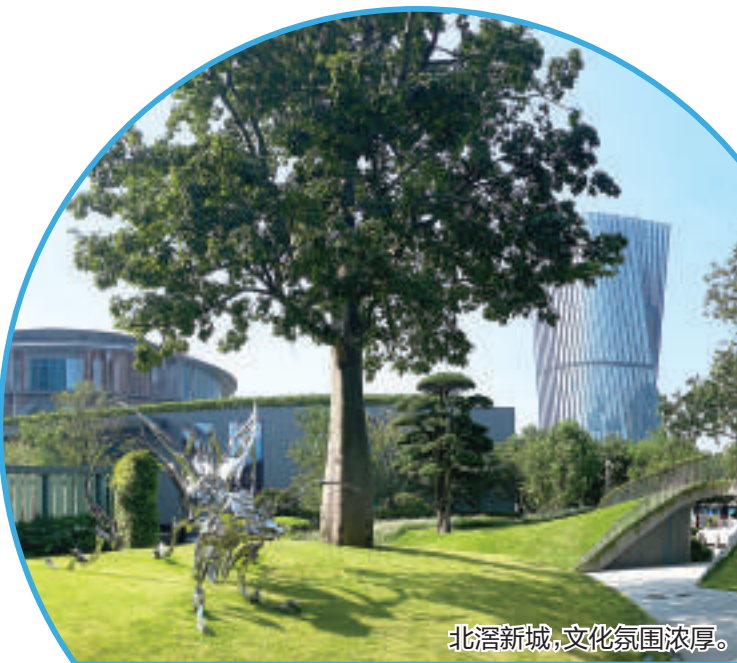
北滘新城，文化氛围浓厚。

在本文写作过程中，记者以碧江蓬莱书院、和美术馆、爱北滘文化共创空间为切入点，窥视人文空间转型升级的重心，发现北滘在构建学习型社会方面做出的积极探索，为社区文化的兴盛和城市审美的提升提供了良好的生态，也为打造“城市文化客厅”，让更多的人读懂顺德、爱上顺德提供了广阔的空间。