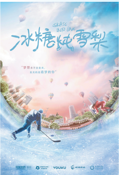
电视剧《冰糖炖雪梨》宣传海报