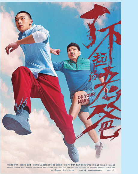
电影《了不起的老爸》宣传海报