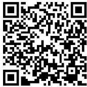
深圳,我想对你说专栏二维码